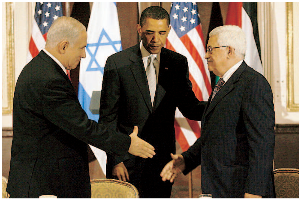
Obama tra Netanyahu e Abu Mazen